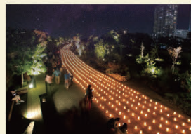
草津街あかり・華あかり・夢あかり イナズマロックフェス

草津市は、滋賀県内で人口増加率1位、JR駅別乗降客数においても県内1位(草津駅)、2位(南草津駅)を占める都市です。江戸時代には東海道と中山道との合流分岐点としての宿場町として栄え、当時の歴史建造物が現存しています。是非、江戸時代の雰囲気を感じてください。