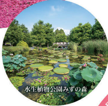
水生植物公園みずの森