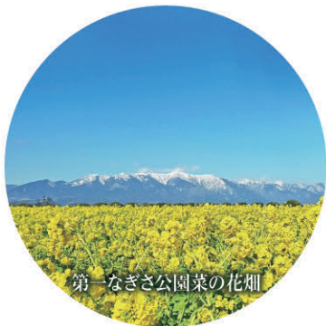
第一なぎさ公園菜の花畑