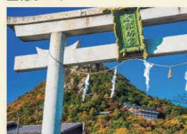
太郎坊宮(阿賀神社)