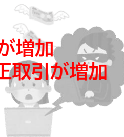
証券口座不正取引額と証券口座に関するフィッシング報告件数