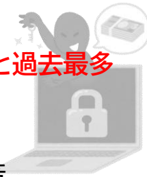
ランサムウェア被害の報告件数