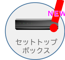
セットトップボックス

セットトップボックス (STB) : ケーブルテレビやインターネット上の動画を家庭用テレビで視聴するための機器。放送用の信号をテレビモニターに表示できる信号に変換する。